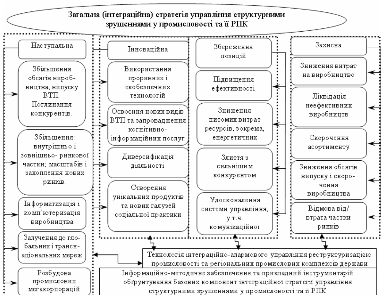
Рис. 2. Конкретизація компонент та змісту загальної стратегії управління структурними зрушеннями у промисловості та її РПК

коригування процесу стратегічного управління структурними змінами в межах реального сектору економіки за рахунок розробки і реалізації відповідного типу загальної (інтеграційної) стратегії, до якої буде інкорпоровано усталений й апробований на практиці інструментарій чотирьох стратегічних програм планування, контролювання і коригування діяльності щодо інтенсифікації структурних зрушень у промисловості України. А саме, у складі: наступальної стратегії, інноваційної стратегії, стратегії збереження позицій, захисної стратегії (рис. 2);