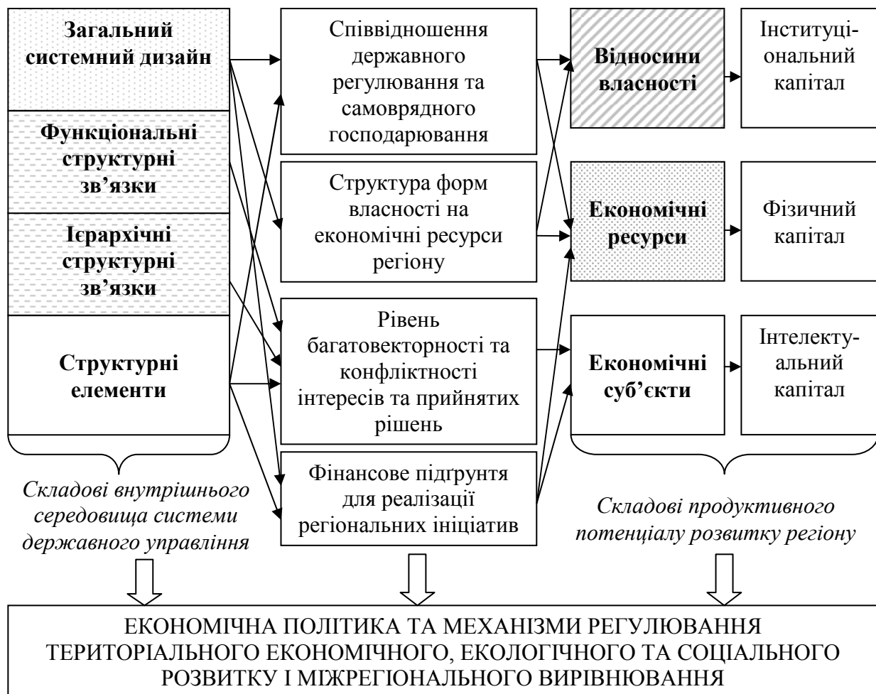
Рис. 2. Вплив складових системи державного управління на продуктивний потенціал розвитку регіону

На відміну від інтелектуального капіталу, інституціональний капітал має низку наступних особливих характеристик. По-перше, інституціональний капітал не може бути привласнений жодним окремим економічним суб'єктом, тому що він є колективним надбанням суспільства держави або певної території. По-друге, інституціональний капітал є обов'язковим для використання під час процесів створення благ усіма економічними суб'єктами, що обумовлює наявність його стабільної частки у вартості продукції та послуг. По-третє, інституціональний капітал не може бути взятий на облік та зарахований до складу необоротних активів окремих підприємств внаслідок неможливості у даний час існування правових основ процесу його привласнення та методики обрахування його фактичної вартості. По-четверте, інституціональному капіталу властиві міжрегіональна, міждержавна та глобальна дифузія, як поступове проникнення, на безоплатній основі у рамках міжнародної кооперації та інтеграції.