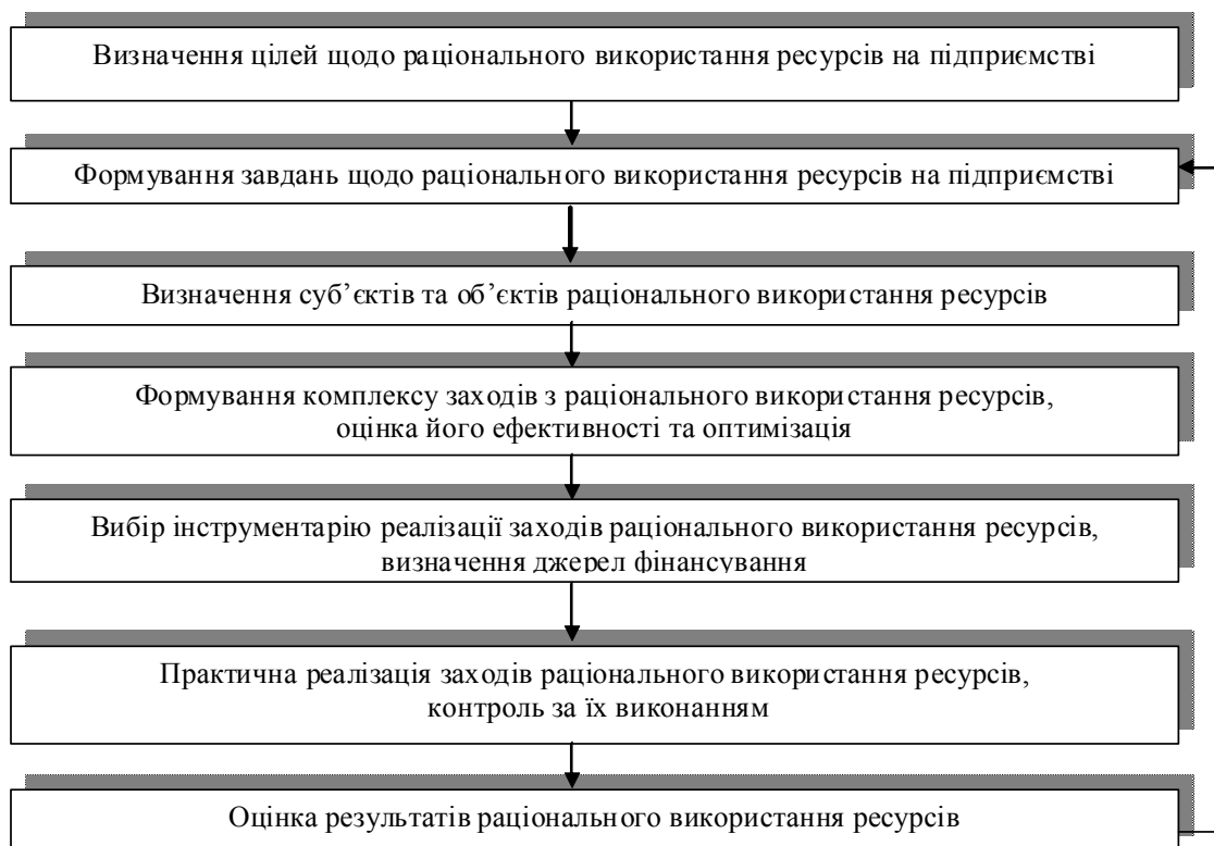
Рис. 1. Етапи організаційно-економічного механізму управління раціональним використанням ресурсів на машинобудівному підприємстві

На третьому етапі визначаються суб'єкти та об'єкти цільового впливу відповідно до поставлених завдань.